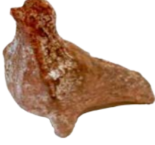
Yunan Dönemi Pişmiş Toprak Kuş Örneği