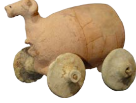
Oyuncak Araba Örneği