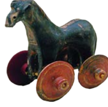
Tarihi Yunan Oyuncak At M.Ö. 950-900